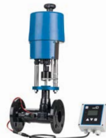
BOA-CVE IMS EKB