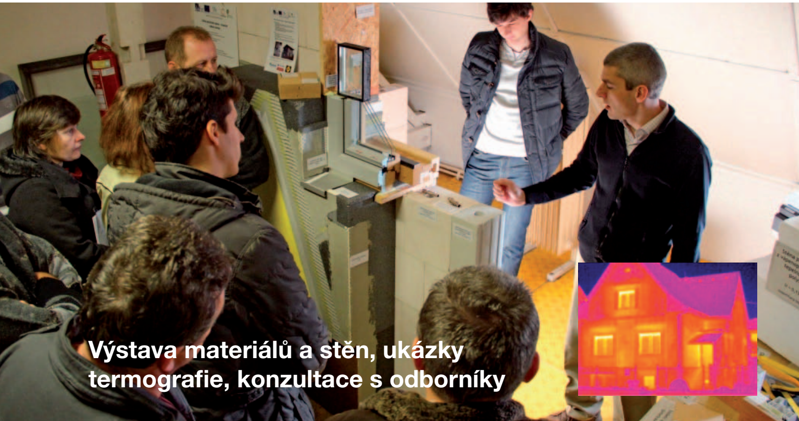
Výstava materiálů a stěn, ukázky termografie, konzultace s odborníky