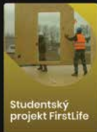
Studentský projekt FirstLife