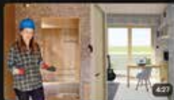
Prošli jsme si dům FirstLife pro soutěž Solar Decathlon 2022 Architektura estav.tv • 31. května 2022 1:00