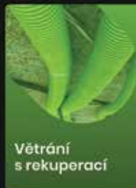
Větrání s rekuperací