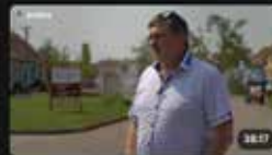
TORNÁDO - Rok poté L di estav.tv • 31. června 2022 9:54

Za projektem estav.tv stojí zkušený tým profesionálů, kteří již více než dvacet let provozují nejnavštěvovanější portály pro stavebnictví, bydlení a TZB ( ESTAV.cz a TZB-info ).