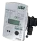
Ultrazvukový měřič tepla ultego® 3