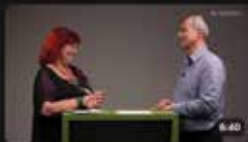
Dálkové měření a rozúčtování - aktuální termíny a povinnosti estav.tv • 7. června 2022 1:00