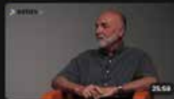
Tepelná čerpadla, která se sama přizpůsobí i starší soustavě Slovo estav.tv • 31. května 2022 12:38