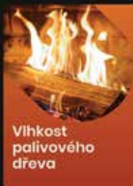
Vlhkost palivového dřeva