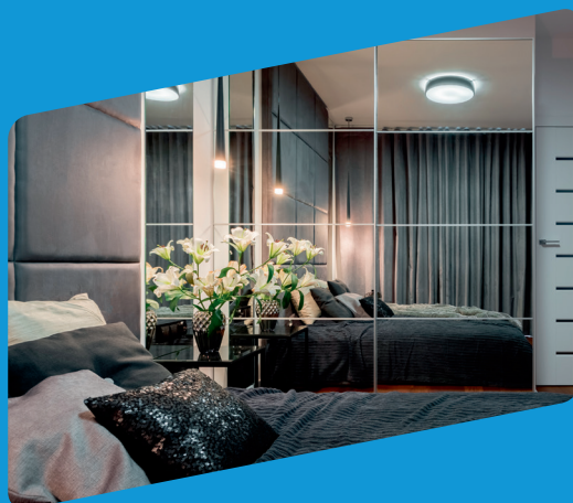
▲ Dveře skříní

MIRASTAR® REFLECT je nejméně průhledné sklo z této produktové řady, vyznačující se silným zrcadlovým efektem a ultra nízkou průhledností. MIRASTAR® REFLECT se snadno instaluje na neprůhledné povrchy: stopy po lepidle nejsou viditelné, takže není potřeba žádné lakování. Je to nejlepší volba pro kuchyňské obklady a nábytek.