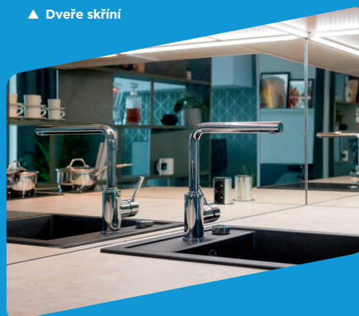
▲ Kuchyňské obklady