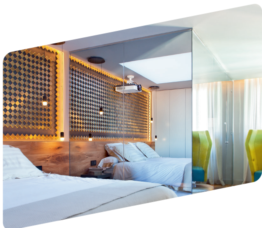
▲ Intenzivnější světlo v ložnici a téměř žádné v koupelně

Tato funkce je také skvělým trikem, jak dle libosti skrýt nebo odhalit místnost, proto se MIRASTAR® někdy nazývá špionážní zrcadlo.