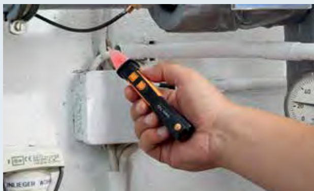
Bezkontaktní měření napětí na rozvodné skříni otopného systému s testo 745.