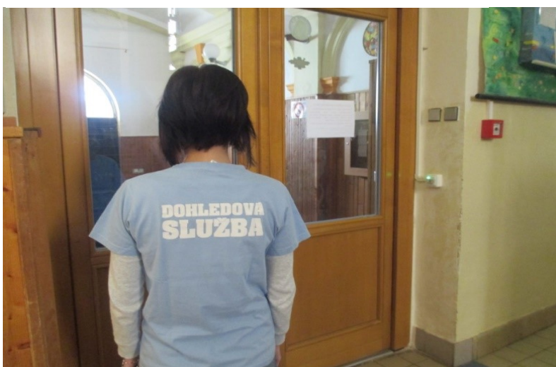
Obrázek 2 - Příklad ústroje č. 1

K možnosti identifikace pracovníka je vhodné připnutí visačky se jménem.