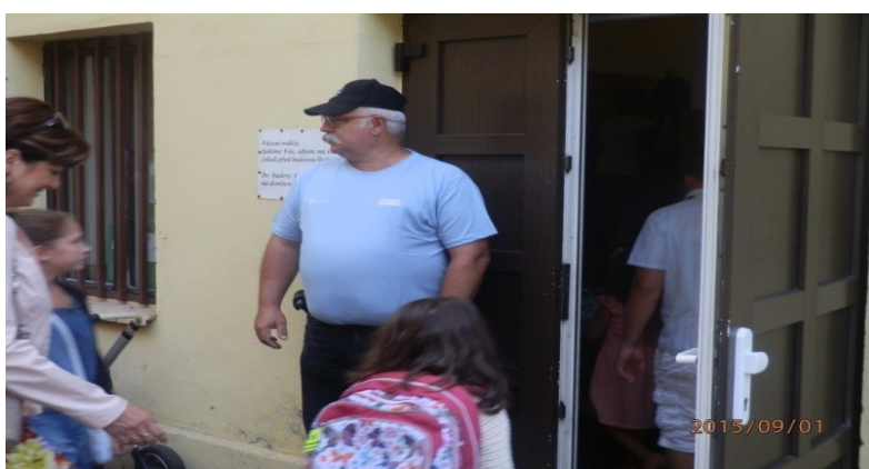
Obrázek 3 - Příklad ústroje č. 2