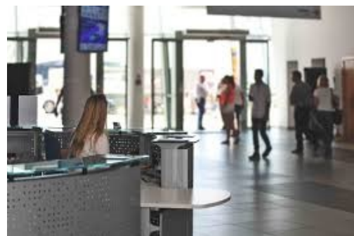
Obrázek 1 - Příklad vhodného umístění recepce

Pro splnění výše uvedeného je vhodný například recepční pult, vrátnice, či místnost proti hlavnímu vchodu do školní budovy 15 , prostřednictvím které bude mít pracovník zároveň zajištěn jako první styk s veřejností.