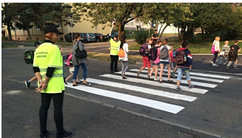
Obrázek 5 - Školní dohledová služba MP Most

Zdroj: https://sever.rozhlas.cz/u-zakladnich-skol-v-moste-zacala-opet-fungovat-dohledova-sluzba-6865175