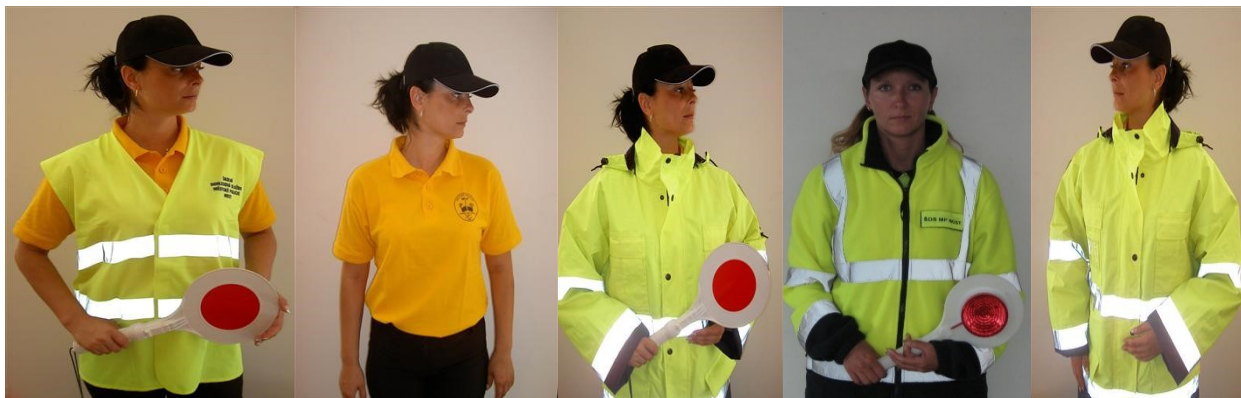
Obrázek 4 - Školní dohledová služba - ústroj