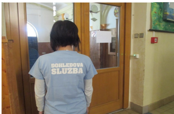
Obrázek 2 - Příklad ústroje č. 1

K možnosti identifikace pracovníka je vhodné připnutí visačky se jménem.