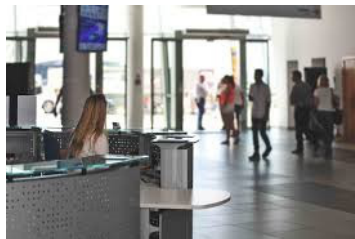
Obrázek 1 - Příklad vhodného umístění recepce

Pro splnění výše uvedeného je vhodný například recepční pult, vrátnice, či místnost proti hlavnímu vchodu do školní budovy 15 , prostřednictvím které bude mít pracovník zároveň zajištěn jako první styk s veřejností.