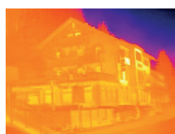
Termosnímek bez testo ScaleAssist

Protože lze teplotní stupnici a interpretaci barev termosnímků individuálně přizpůsobovat, je možné, že je např. teplotné technické chování budovy špatně interpretováno. Funkce testo ScaleAssist řeší tento problém tím, že přizpůsobuje rozložení barev stupnice vnitřní a vnější teplotě měřeného objektu a rovněž jejich rozdílu. To zajišťuje objektivně porovnatelné a bezchybné termosnímků.