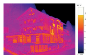
Termosnímek s testo ScaleAssist