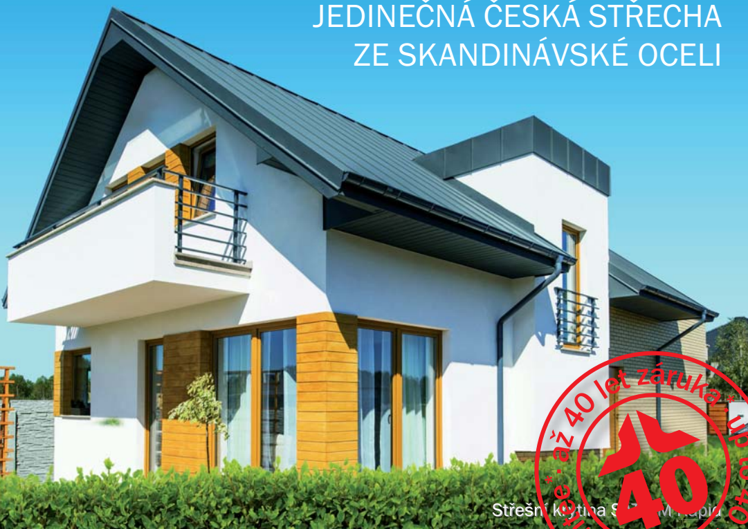
Střešní krytina SATJAM Purex