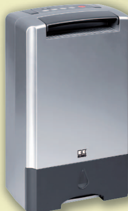
REMKO ASF 100