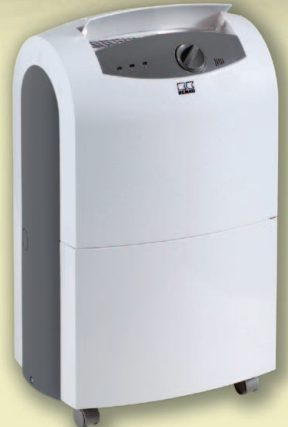
REMKO ETF 320