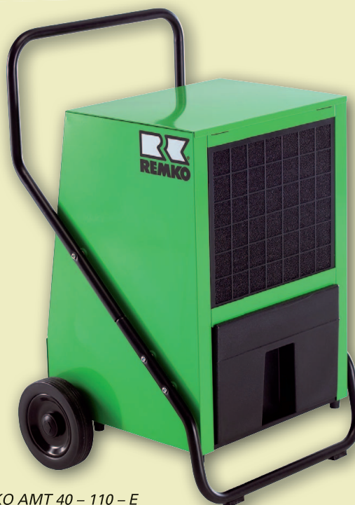
REMKO AMT 40 - 110 - E