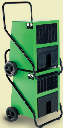
REMKO odvlhčovače jsou stohovatelné

REMKO odvlhčovače se znamenitě hodí k hospodárnému sušení v prostorách sklepů a sušáren, zájmových dílen, zimních zahrad, v lázních, pracovnách, centrech pro volný čas, archivech, skladech atd.