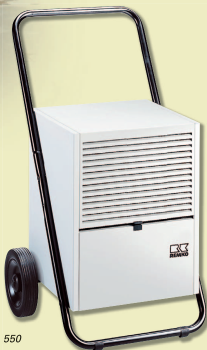
REMKO ETF 400, 550