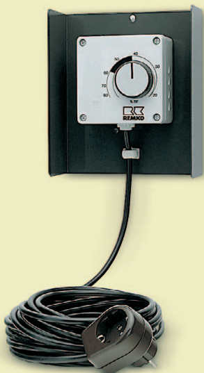
REMKO prostorový hygrometr pro automatické ovládání přístroje

K zabránění škod způsobených vlhkem a k zajištění nepřetržitého postupu prací se doporučuje použití odvlhčovačů.